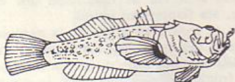
la Rascasse blanche