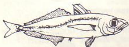
le Coustut, ou Chinchard